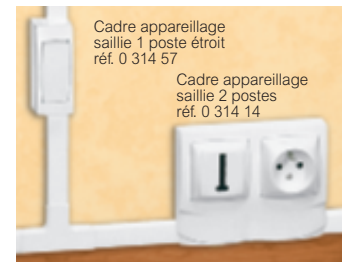
Tableau de choix p. 738 à 741