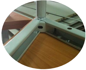
Pieds tube rond 30 mm