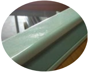
Ceinture tôle plié 40 x 25 mm