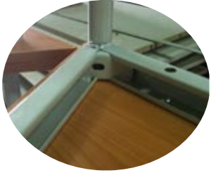
Pieds tube rond 30 mm